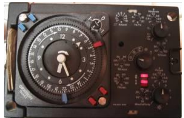
TEM 21.. / 29.. / 31.. / 35..