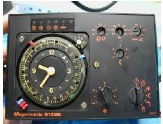
Elfatherm AEG E22