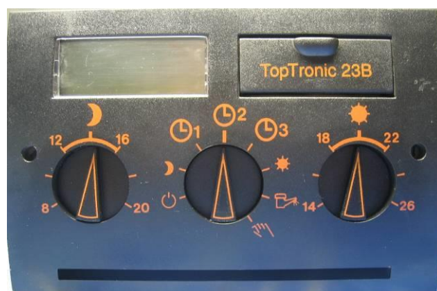
Top Tronic 223B / 23B / usw