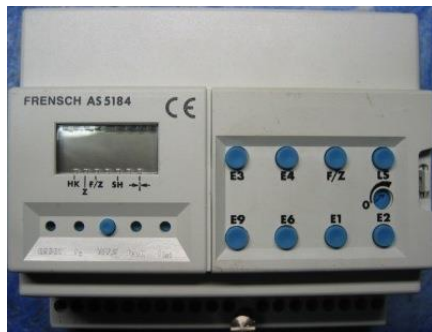
Frensch AS 5184