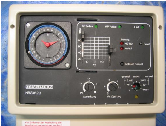
Stiebel EltronHRGW 2U