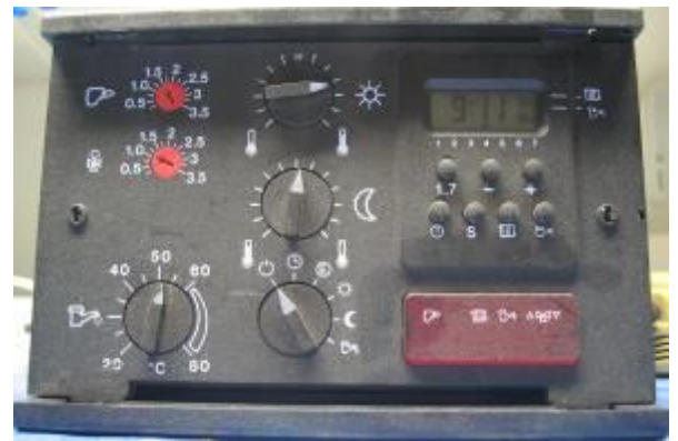
Alpha R23 / 233