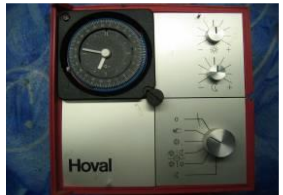
Hoval RTK 3B / RKS 3B