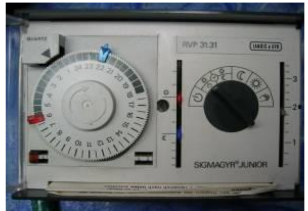
Heizungsregler Landis & Gyr Serie RVP „Anlog“ 21 /30 / 31 / 32