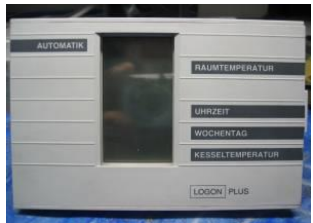
Cuenod/Klöckner LOGON PLUS