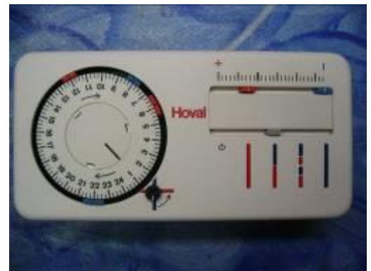
Hoval EG86A EG86B