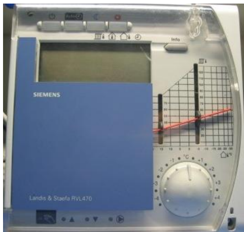
Heizungsregler RVL 47 bis 480