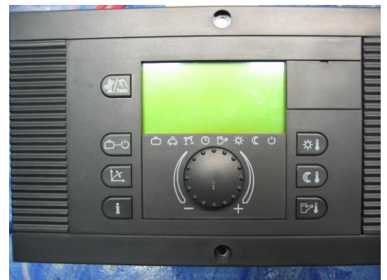
EBV / Theta / Top Tronic T