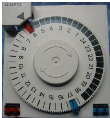
Schaltuhr AUZ 1.4