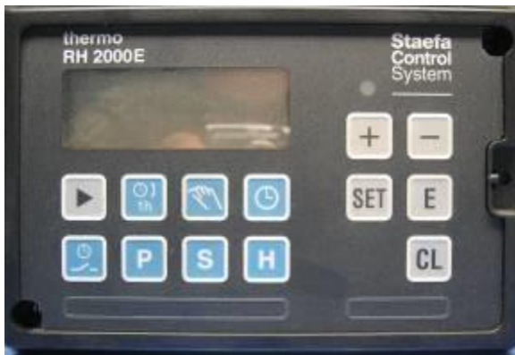
SCS RH 2000/2002