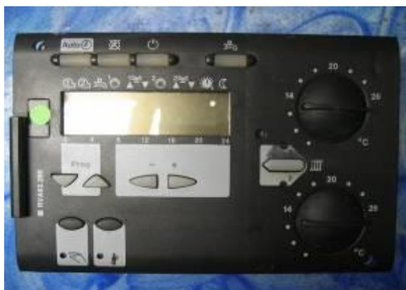
Heizungsregler Siemens/Albatros Serie RVA 46. / 53. / 63. / 66.