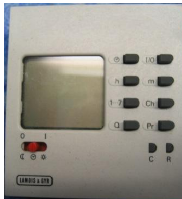
Schaltuhr AUD 1.2