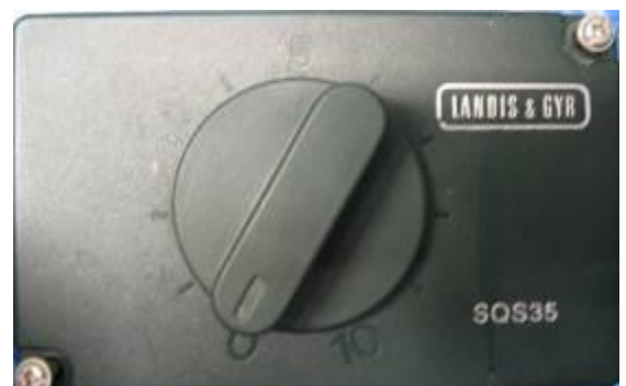
Mischerantrieb SQS 35