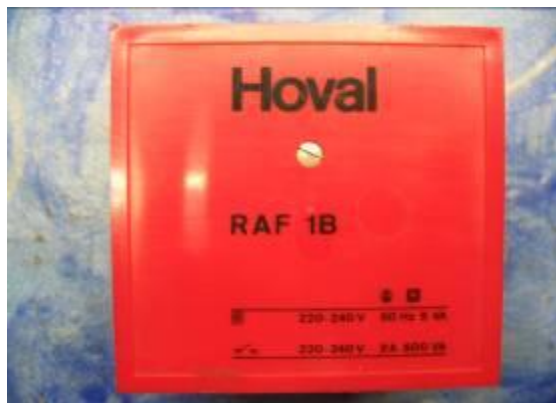
Hoval RAF 1B