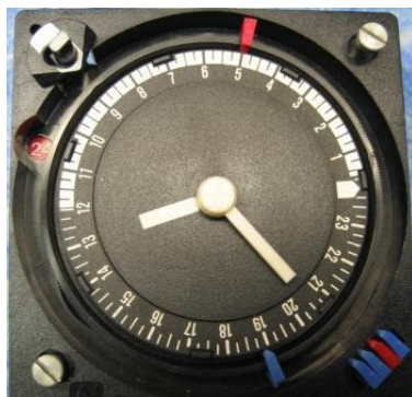
Schaltuhr RAM 388