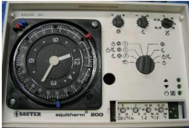
Sauter equitherm 100/200 usw