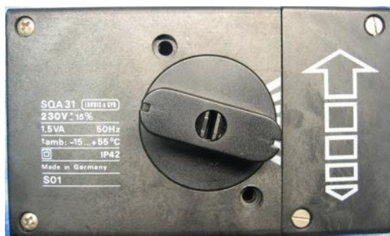
Mischerantrieb SQA 31