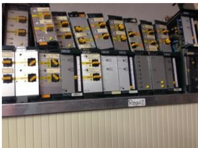
Diverse Polygyr Ersatzteile