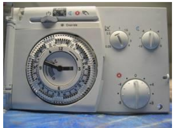
Heizungsregler RVP200 usw.