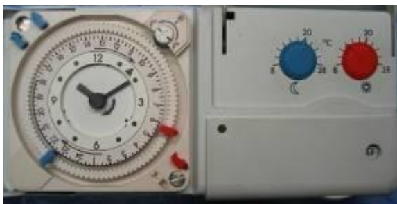
Raumgerät DWS chronostat 4E