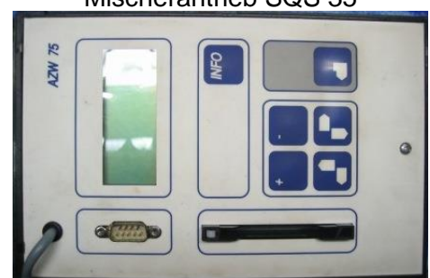
Programmiergerät AZW 75