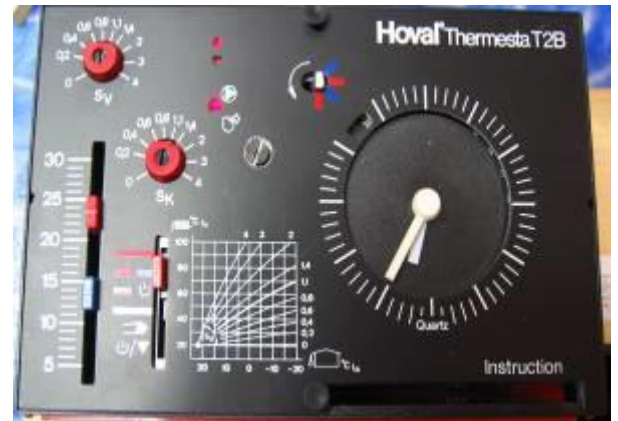
Hoval Thermosta T2B / T5B/ T6B / T8B