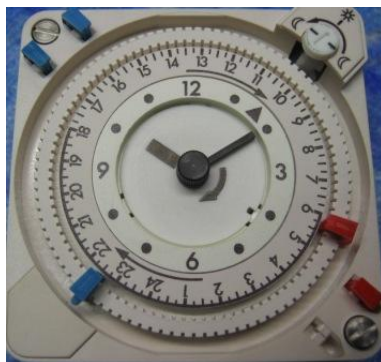
Alle Grässlin Schaltuhren