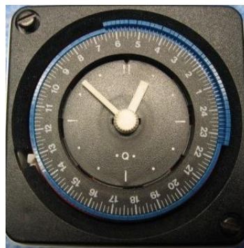
Schaltuhr Maxi Rex