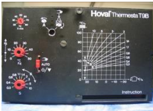
Hoval Thermesta T9B