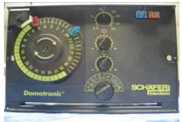
Heizungsregler Landis & Gyr RVP 41./ 51.