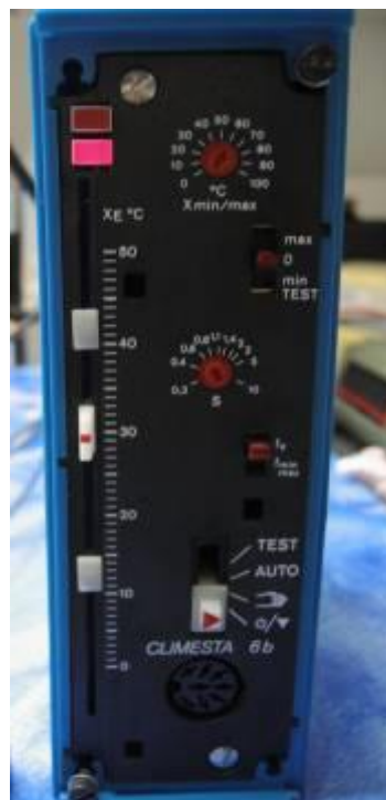
ELESTA Climesta 6B u.s.w.