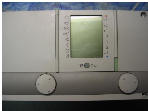
TEM IT 5710 / 11