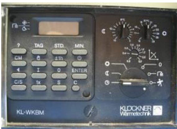
Klöckner KL-WKBM / WKB / WZB