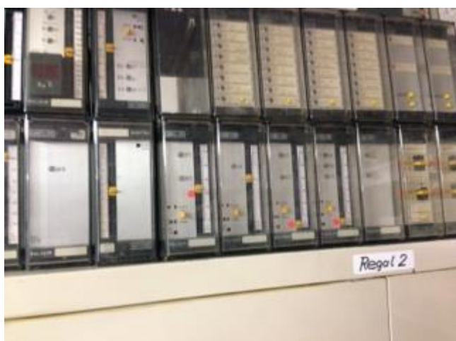
Diverse Polygyr Ersatzteile