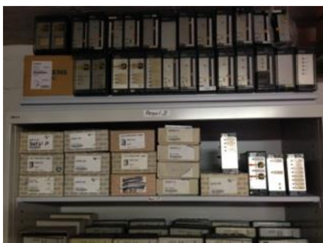
Diverse Polygyr Ersatzteile