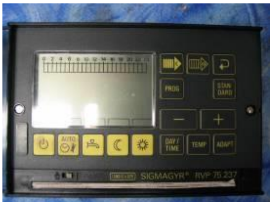
Heizungsregler Landis & Gyr Serie RVP 20/40 / 45 / 54 / 55 / 75 / 76 / 97