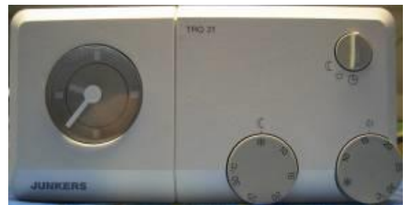
Raumgerät Junkers TRQ21