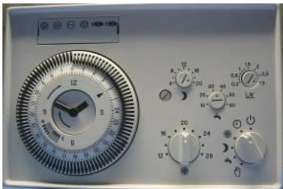
Alpha R23 / 233